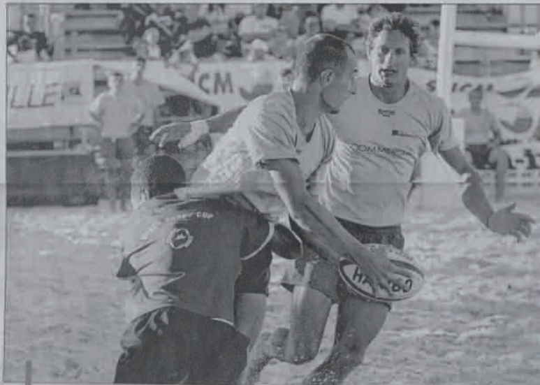
Le tournoi phare de la manifestation permettra à l'équipe victorieuse de se qualifier pour la finale du circuit qui se déroulera les 20 et 21 juillet à Lignano (Italie).

Deuxième l'an dernier, les Marseillais comptent bien franchir le dernier pallier cette année pour se qualifier ainsi pour la finale, à Lignano. Pour