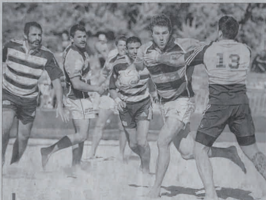
Le niveau du beach rugby est de plus en plus relevé d'année en année. La finale de cette étape marseillaise du Beach Rugby Five l'a démontré.

Les deux équipes italiennes de Rome et Gênes, habituées aux compétitions sur sable, paraissent favorites. Mais c'était sans compter sur la vivacité de l'équipe d'Ovale Beach, qui a largement dominé sa poule lors des phases qualificatives. En fin d'après-midi, c'est donc une finale au sommet entre Roma Maccaresse et Ovale Beach qui fait vibrer le public. Le match