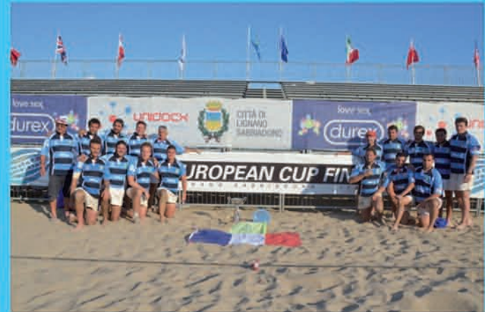
Ovale Beach Marseille Champion d'Europe European Beach 5's Rugby Series 2013