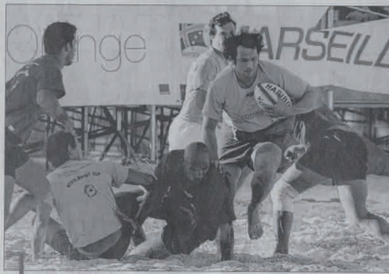
Une dizaine d'équipes, dont deux italiennes et quatre marseillaises, assurera demain le spectacle lors du tournoi majeur du week-end.