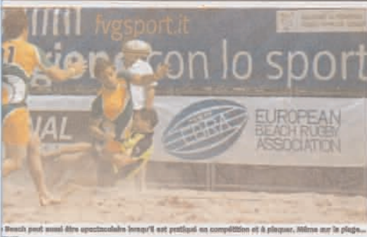
Beach peut aussi être spectaculaire lorsqu'il est pratiqué en compétition et à plaquer. Même sur le plage...