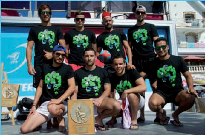
Gignac - Marignane Rugby Division Champion de France de Beach Rugby 2011 & 2013