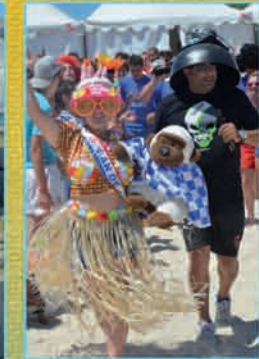
animation spéciale de Gilbert Bourguignon