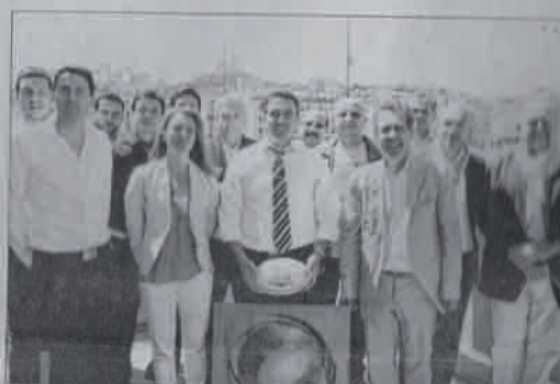
Partenaires privés et institutionnels ont assisté hier à la présentation de la manifestation au club Pernod.

EBRA Beach Rugby 5's Rugby Series, du 21 au 23 juin, plages du Prado.